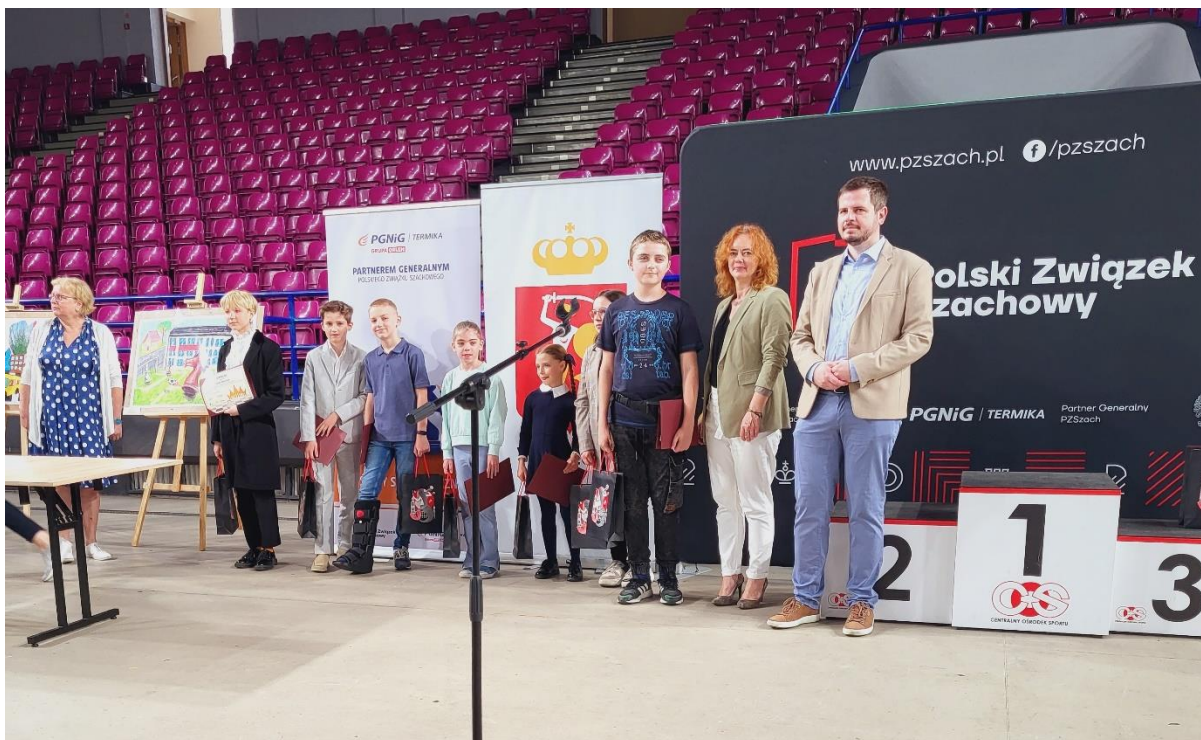
Uroczyste otwarcie X Turnieju Finałowego, 10.06.2024, COS Torwar