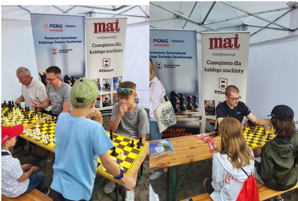
Stoisko PZSzach podczas Pikniku Rodzinnego przy KPRM w Warszawie