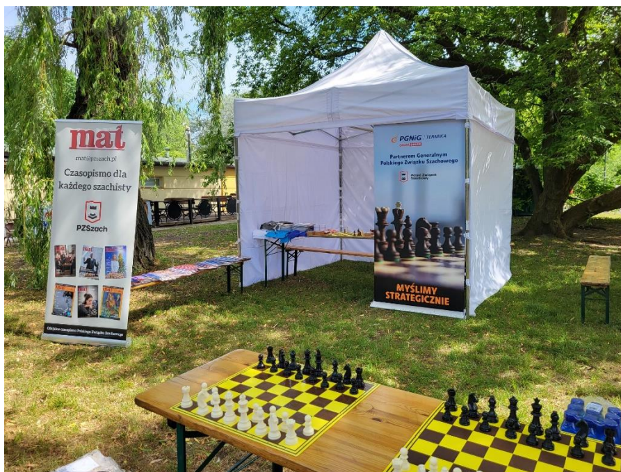
Stoisko PZSzach podczas Pikniku Olimpijskiego na Kępie Potockiej w Warszawie

Polski Związek Szachowy jest jednym z najstarszych związków sportowych w Polsce, który może pochwalić się wieloma sukcesami. Prawie 100-letnie doświadczenie organizatora prestiżowych turniejów oraz świetne wyniki promocyjne na kanałach komunikacji społecznej zachęcają firmy do kontynuacji współpracy z PZSzach. Prestiżowy tytuł Partnera Generalnego PZSzach należy w 2024 roku do PGNiG Termika SA. Ze względu na lokalizację głównej siedziby firmy oraz należących do niej elektrociepłowni kierownictwu Biura Komunikacji PGNiG Termika SA bardzo zależy na promocji marki podczas najważniejszych wydarzeń szachowych w kraju i zagranicą, a w szczególności - w Warszawie oraz na Mazowszu. Realizując oczekiwania najważniejszego partnera Polski Związek Szachowy zorganizował już trzy edycje Otwartego Turnieju Szachowego o Puchar Prezesa Zarządu PGNiG Termika oraz był obecny ze swoimi stoiskami podczas Pikniku Olimpijskiego przy PKOL oraz Pikniku rodzinnego z okazji Dnia Dziecka w ogrodach KPRM. Podczas obu Pikników promowano najważniejsze projekty PZSzach, a animatorzy organizowali turnieje blitza oraz quizy wiedzy o szachach.